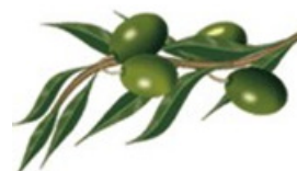
IL RAMO D'ULIVO