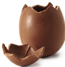
L'UOVO DI CIOCCOLATO