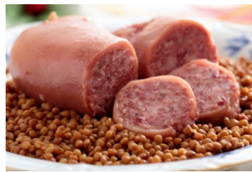
LE LENTICCHIE E IL COTECHINO