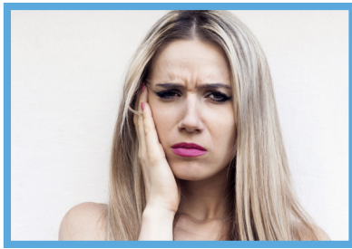
ha il mal di denti