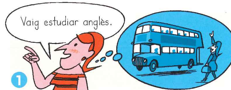
1 en un temps llunyà

C. Observa les il·lustracions següents i tria quina de les dues representa millor les experiències passades de les persones de l'activitat B. Saps quina diferència hi ha? Parla'n amb un company.